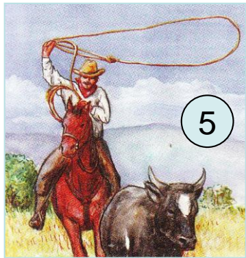
Cowboy mit Lasso